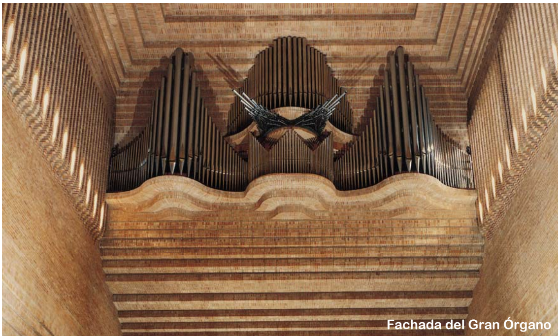
Fachada del Gran Órgano